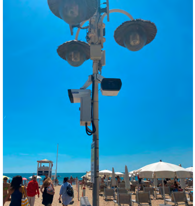
Panomera®-Kameras haben auch Strandbereiche im Blick.

Außerdem erfüllen Dallmeier Videoüberwachungssysteme alle Kriterien, die für eine Beweisführung vor Gericht ausschlaggebend sind. Bildqualität, Manipulationsicherheit und der Schutz vor Fremdzugriff entsprechen der LGC Forensics Zertifizierung.