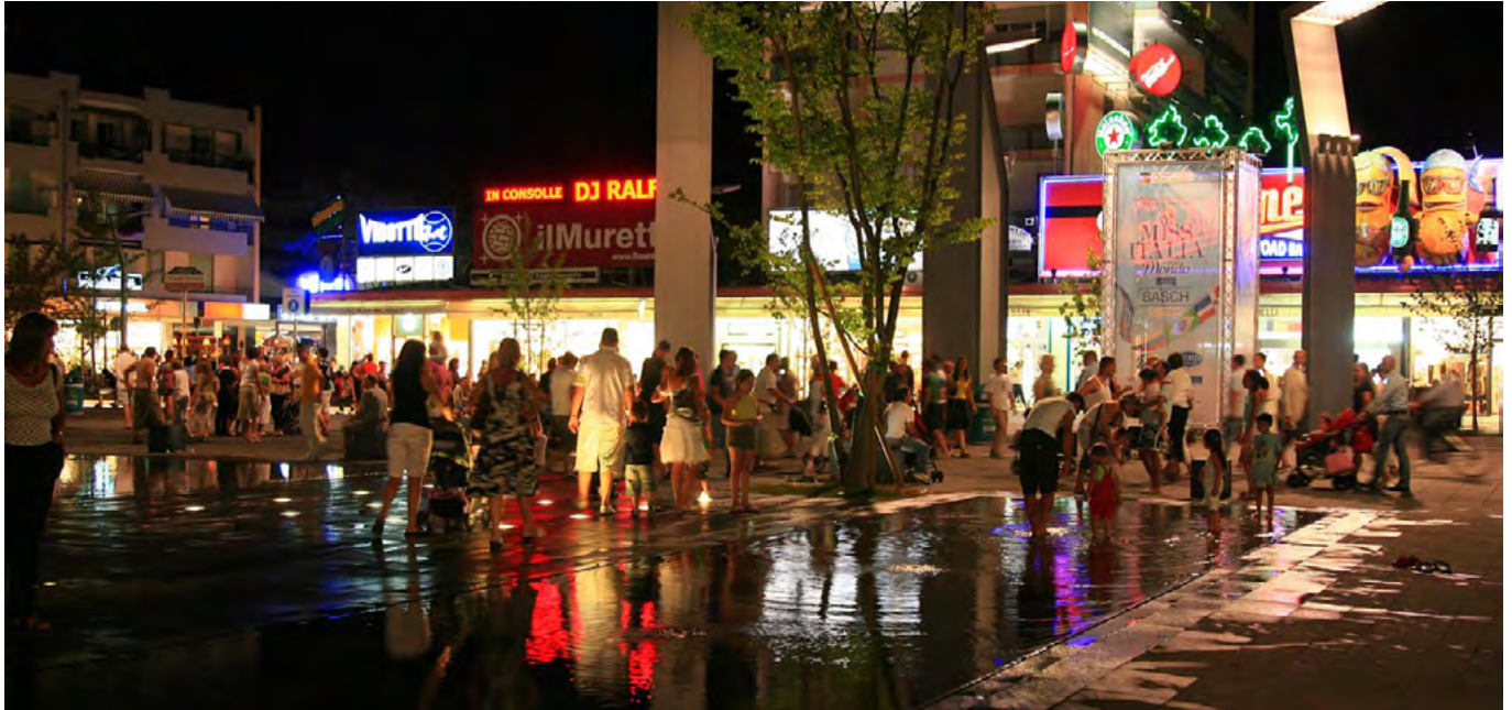
In den Sommermonaten pulsiert das Nachtleben in Jesolo.