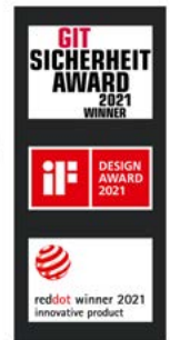
Cámaras de sensores multifocales Panomera®

seguridad para la Planta II con componentes del portfolio de Dallmeier, consistiendo en cámaras de sensores multifocales Panomera®, cámaras domo megapíxel, el sistema de grabación IPS 10.000 y el software de gestión de vídeo SeMSy® Compact.