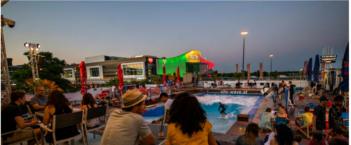
Videoseguridad discreta “made in Germany”: una cámara domo Dallmeier (en la parte superior izquierda de la imagen) capta la actividad en la plataforma CityWave