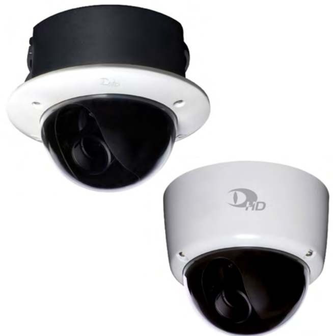
CityWave Austria usa cámaras domo Dallmeier con resolución 4K para captar todo lo que sucede en la plataforma a pesar de las condiciones de luz difíciles